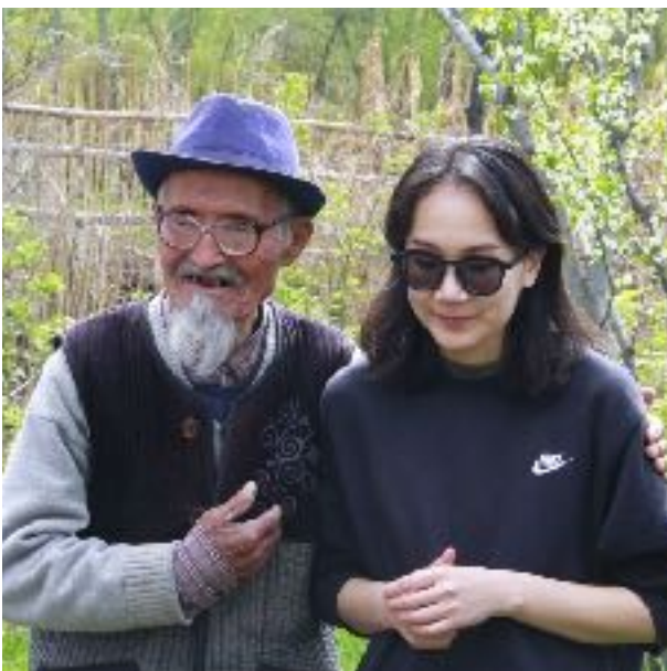
Berätta för oss om Jesus bad den gamle mannen

Resans höjdpunkt var när de kom till en by som beboddes av kalmucker. Vid ett tillfälle hade ett antal kalmucker samlats för att lyssna