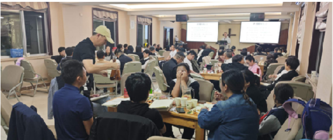
En ny kurs för pastorer, körmedlemmar m.fl. har startat.