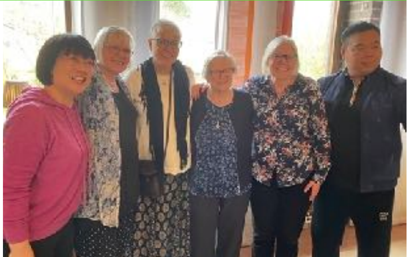
Årshögtiden 2024. Gäster från Kina och Sverige.

I oktober arrangerade vi en ny kurs "Joshua" i Sanmenxia, som nu har börjat utan problem. Deltagarna inkluderar bl.a. pastorer, körmedlemmar och bibelpredikanter. Efter att ha tagit itu med denna kurs kom jag till Wenzhou.