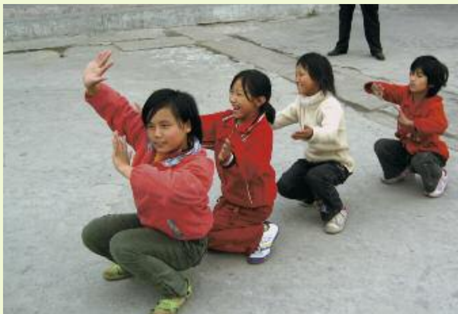
I staden Shangqiu finns ofattbara 430 000 handikappade. Den särskola som EÖM stöder tar emot 135 elever. De flesta av dem är döva eller dövstumma.

Vad ni har gjort för någon av dessa minsta har ni gjort mot mig... (Matt 25:40). I Shangqiu där vi driver ett hiv/aids projekt finns en skola för barn med speciella behov. EÖM har vid flera tillfällen besökt skolan och gripits av personalens engagemang för att hjälpa de som oftast har ett hopplöst utgångsläge i Kina. Skolan grundades 1986 för att hjälpa döva och utvecklingsstörda barn. Idag har centrat 15 klasser med 135 elever varav 62 är döva och 23 utvecklingsstörda. Övriga elever är döva förskolebarn. Det har visat sig att skolan i Shangqiu har stor strategisk betydelse