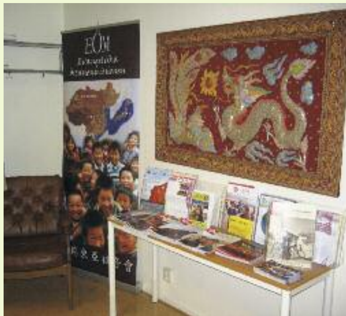
EÖMs bibliotek i Tranås består i huvudsak av böcker och dokument som rör Kina, Mongoliet och Japan. Här finns också övernattningsrum för gäster till missionen.

och Mujnkkuu. Vi följer dem i offer och förböner.