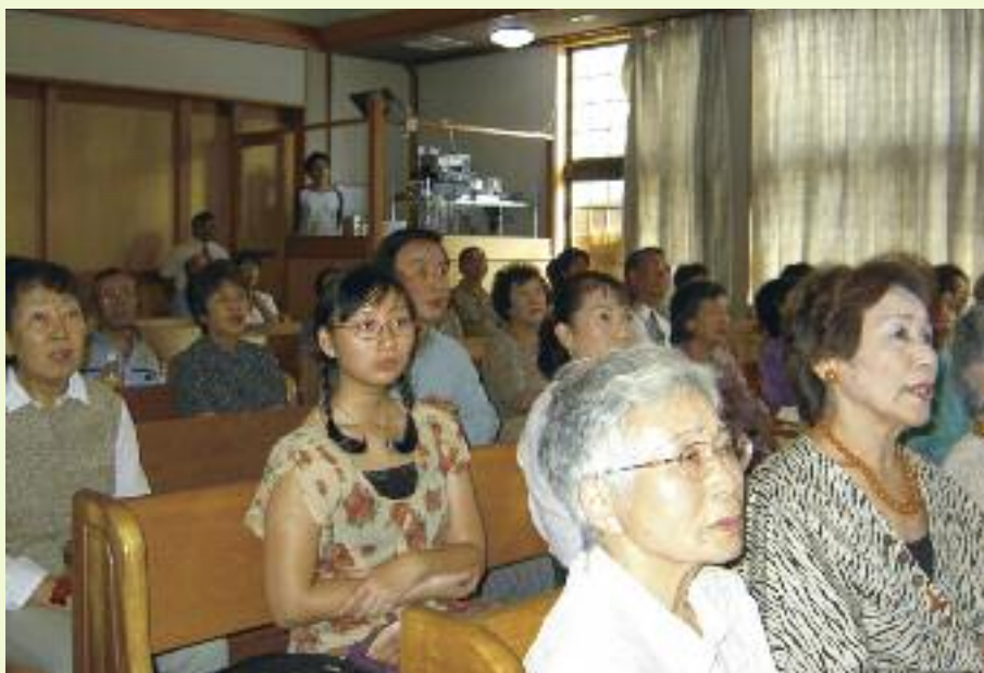
Från konferens i Mishima, Japan.