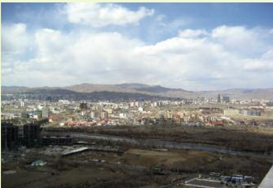
I staden Erdenet finns idag flera livskraftiga församlingar och missionscentrat MMC.