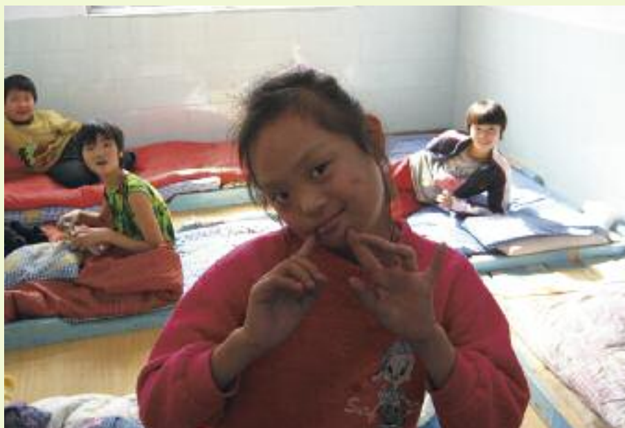
Klassrummen blir sovsalar efter skoltid. Eleverna som bor på skolan skulle behöva en fast punkt i sin tillvaro.